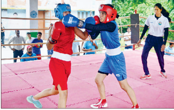
मिवानी। बॉक्सिंग रिंग में प्रतिद्वंदी पर मुक्के बरसाते हुए व कुश्ती स्पर्धा में दांव पेच लगाते हुए।