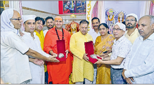
भिवानी। कार्यक्रम में मुख्य अतिथि को सम्मानित करते हुए।