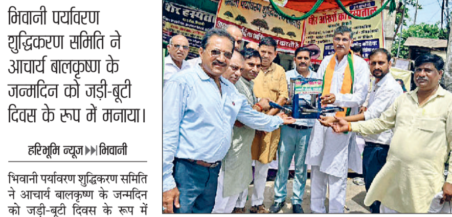
भिवानी। पक्षियों के दाना पानी के लिए टीन भेंट करते अतिथि।