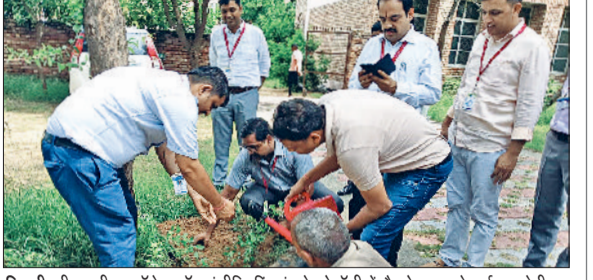
भिवानी। बीआरसीएम कॉलेज ऑफ इंजीनियरिंग एंड टेक्नोलॉजी में पौधारोपण करते पर्यावरण प्रेमी।