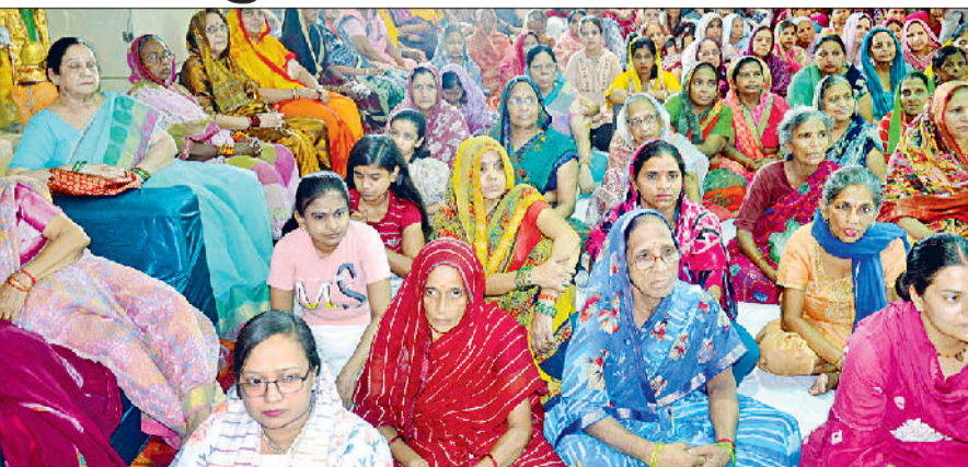
भिवानी। श्रीमद्भागवत कथा सुनती श्रद्धालु।

की लीलाओं, धर्म के महत्व और जीवन के सत्य मार्ग की ओर प्रेरित कर रहे हैं। तीसरे दिन की कथा में स्वामी गोवर्धन आचार्य महाराज ने राजा परीक्षित की कथा, देवहूति और कर्दम ऋषि की संतान कपिल