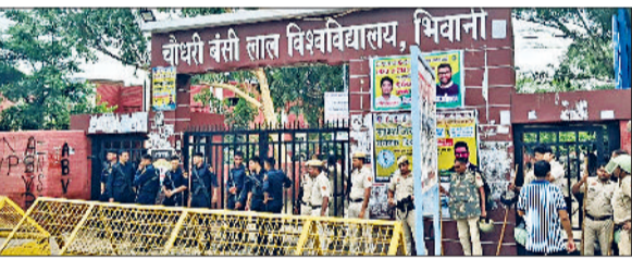
भिवानी। सीबीएल्यू के गेट के बाहर की गई बैरिकेटस का दृश्य।