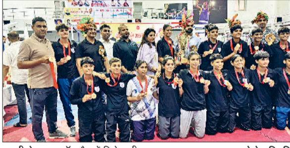
बवानीखेड़ा। फुटबॉल मैच में विजेता टीम।